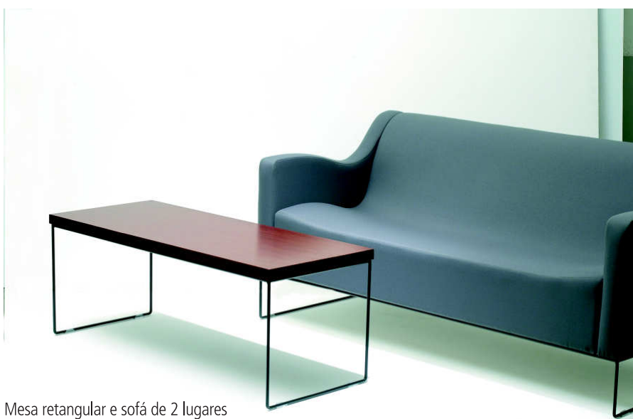
Mesa retangular e sofá de 2 lugares