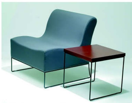
Poltrona sem braços e mesa quadrada